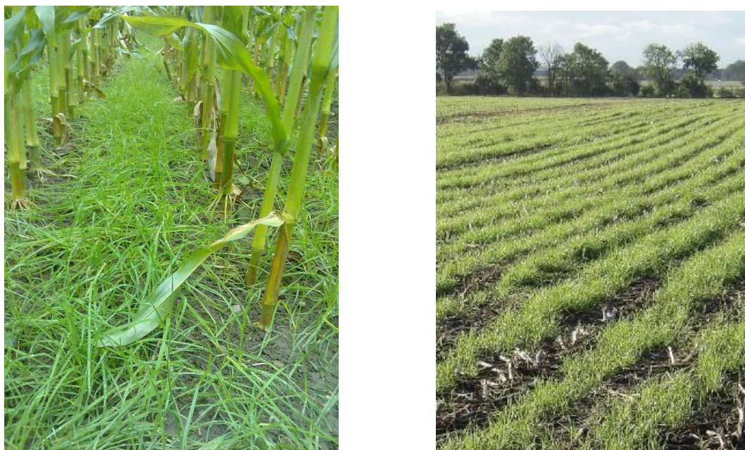
Abb. 1 Gras Untersaaten vor und nach der Maisernte

Damit die Untersaat gelingt sind einige Punkte zu beachten: