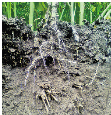
Abbildung 4: Winterrips auf einem stark verdichteten Unterboden

Einmal zerstörte Unterbodengefüge sind nicht so leicht wieder herstellbar. Wichtig ist, dass eine umfassende Diagnose und Schadbewertung vorgenommen wird. Zur Beurteilung des chemischen Bodenzustandes werden aktuelle Grundnährstoffanalysen, und hier insbesondere der pH-Wert sowie dessen Abweichung vom Ziel-