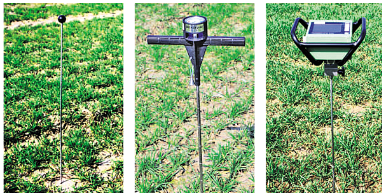
Abbildung 1: Verschiedene Bodensonden zur Ermittlung der Eindringwiderstände.

Die Humuszehrung heutiger Fruchtfolgen sowie die vielfach zu