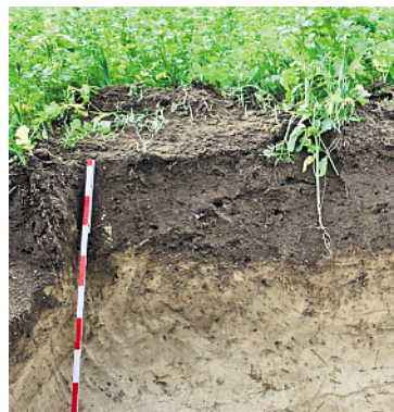
Abbildung 5: Beispiel einer gelungenen Unterbodenlockerung

wurzelnder beziehungsweise das Bodenleben fördernder Zwischenfrüchte (multiresistenter Ölrettich, Lupinen, Rübsen, Tillage-Radish beziehungsweise geeignete Gemenge) und Hauptfrüchte (Raps, Zuckerrüben, Luzerne),