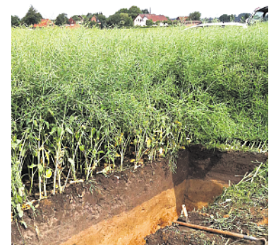
Abbildung 2: Begehbare Bodenprofilgrube.