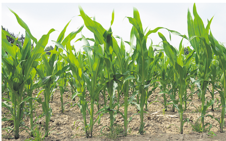
Messungen des N min -Wertes zu Mais Anfang Juni mit der sogenannten Spätfrühjahrs-N min -Methode geben Aufschluss über die tatsächliche Mineralisationsleistung des Bodens.

Durch die Reduzierung der N-Düngung um die Hälfte ist im Mittel auf den 21 Pilotchlägen ein Herbst-N min -Wert von nur 36 kg N/ha gemessen. Umgerechnet auf das winterliche Sickerwasser, ergibt sich daraus eine sehr geringe Nitratauswaschung von etwa 50 mg/l. Die Vergleichsgruppe mit normaler Düngung (158 kg N/ha) lag bei fast 80 kg