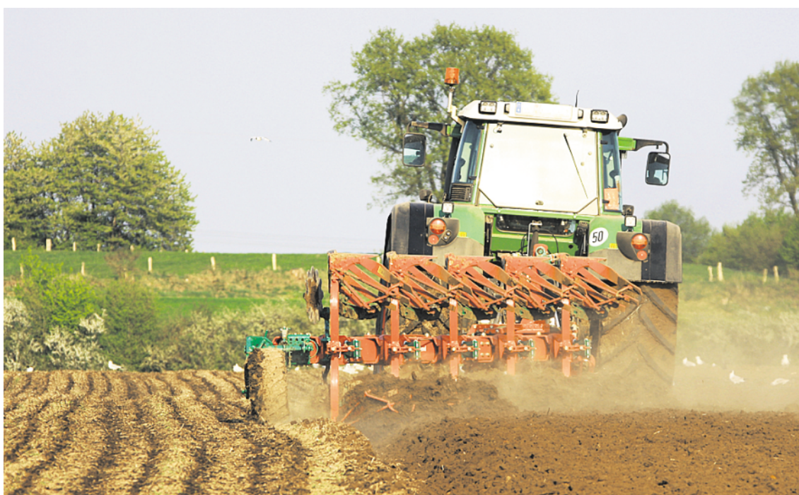
Die bodennahe Ausbringung – zeitnah zur Saat mit unmittelbarer Einarbeitung – erhöht die Düngewirkung der Gülle sowie Gärsubstrate und senkt die Belastung der Umwelt.

ne Überdüngung. Weder die Qualitäten noch die Standfestigkeit leiden so wie bei anderen Kulturen. ● Der „gefühlte“ Geldwert der Gülle ist gering. Sie fällt ohnehin an. Es fehlt der Anreiz, die Düngung zu re-