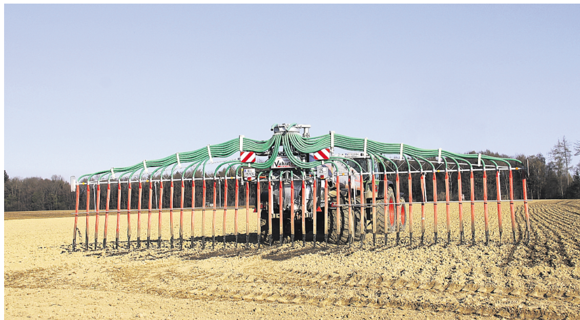
Sollten die Messergebnisse unter 180 kg N/ha liegen, kann Mitte Juni in den Bestand hinein noch mineralisch oder organisch mit Schleppschläuchen nachgesteuert werden.

2) Frühjahrs-N min -Wert Der Frühjahrs-N min -Wert ist vom Sollwert abzuziehen. Er wird möglichst kurz vor der Düngung, also Ende März/Anfang April gemessen. Anders als im Februar (Frühjahrs-N min -Wert zu Getreide) können bis dahin die N min -Werte schon deutlich angestiegen sein. Dieser Ammonium- und Nitrat-Stickstoff ist bis zu einer Tiefe von 90 cm bei der Düngung anzurechnen, weil die Maiswurzeln später auch den ganzen Wurzelraum erschließen.