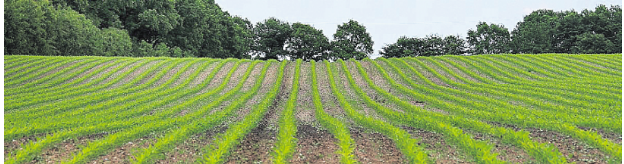
Die Maisdüngung kann an die jeweiligen Standortverhältnisse mittels Düngesplitting angepasst werden.

Seit dem 22. Dezember 2000 ist die Richtlinie in Kraft. Sie gilt für alle Gewässer Europas, das heißt für Oberflä-