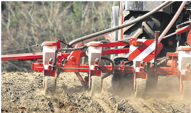
Die SFN-Methode ermöglicht jedem Landwirt, die N-Versorgung seiner Maisbestände vor Beginn der Hauptwachstumsphase schnell und zuverlässig zu überprüfen.

Zwischenfazit: Die SFN-Methode ermöglicht jedem Landwirt, die N-